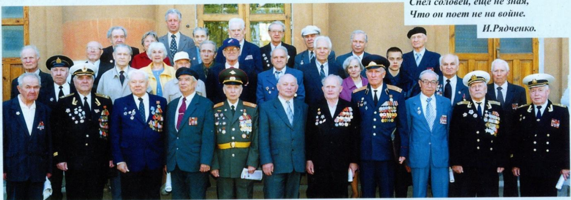
Ректор РГРТА профессор В.К.Злобин с ветеранами Великой Отечественной войны - участниками торжественного собрания академии 7 мая 2002 года.