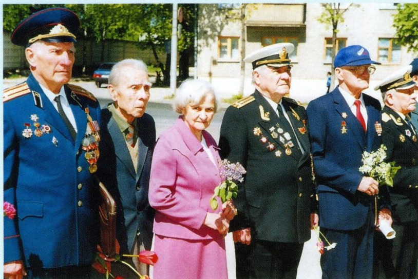
Наши славные ветераны в День Победы. 2002 год.