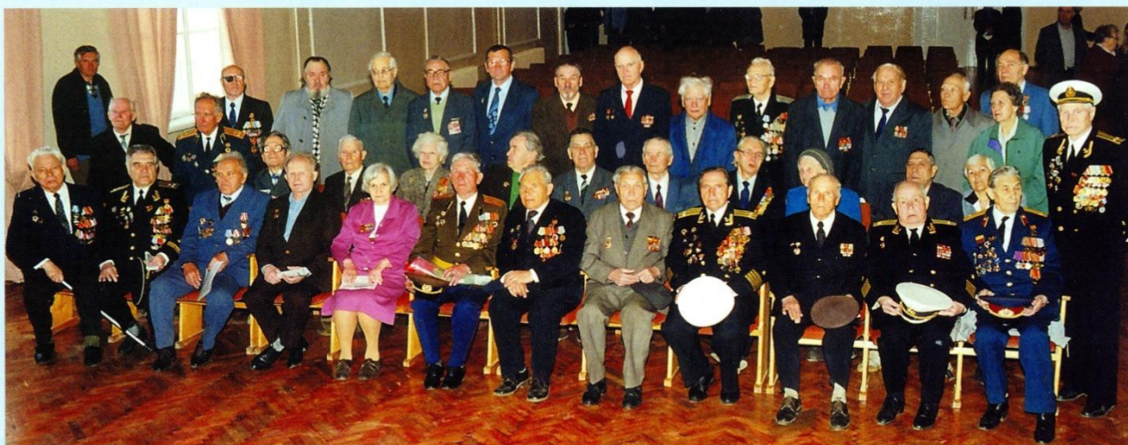
Ветераны - участники торжественного собрания академии 7 мая 2000 года.