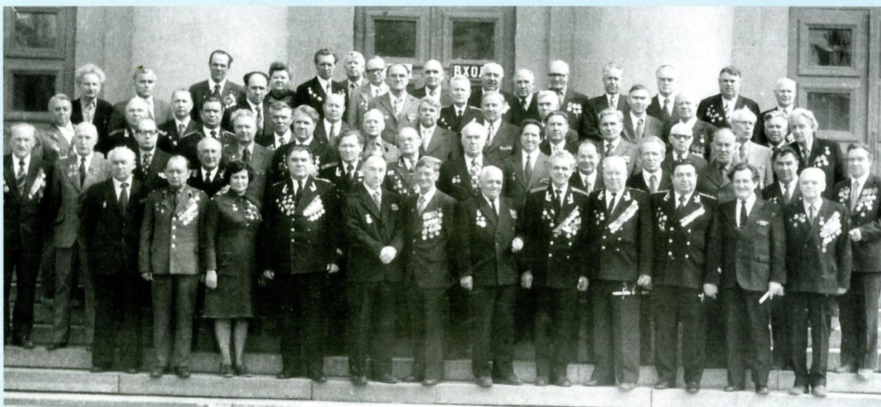
Ветераны Великой Отечественной войны в день 40-летия Победы.