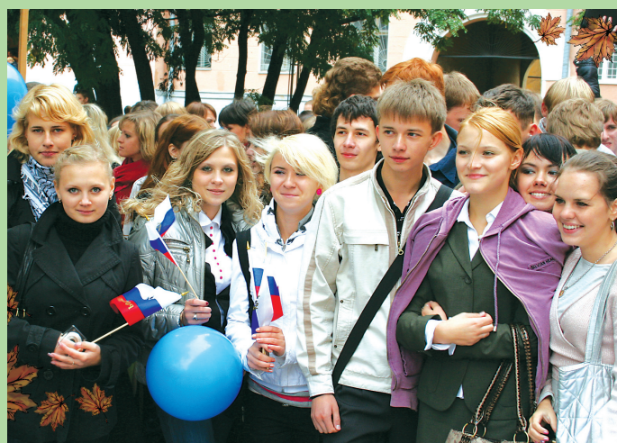
Группа 8612: «Теперь мы студенты!»