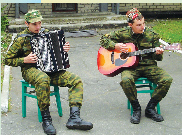
Наше творчество всем пришлось по душе.