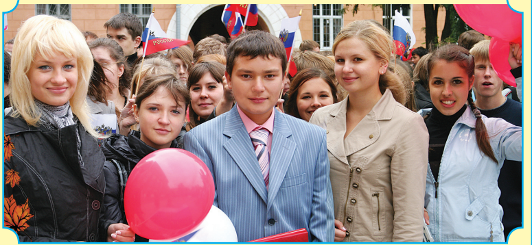
Самый памятный сентябрьский день.