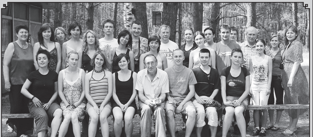
Польские студенты с удовольствием отдохнули в «Зеленом бору».

Беседовали Н. МОРОЗОВА и Е. ТОЛОЧАНОВА, гр.8612.