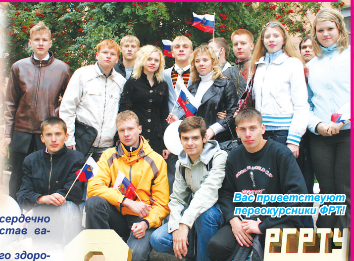
Вас приветствуют первокурсники ФРТ!

Н. БУШКОВА, министр образования Рязанской области.