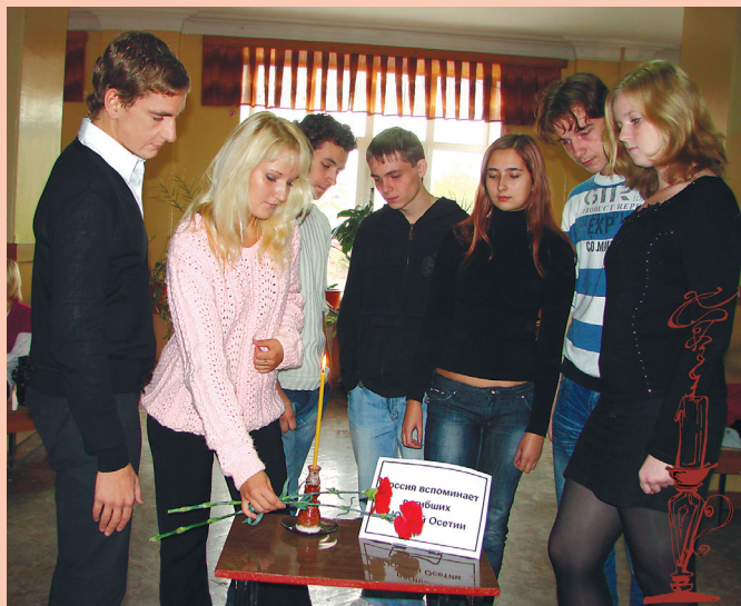
Цветы – в память о погибших.