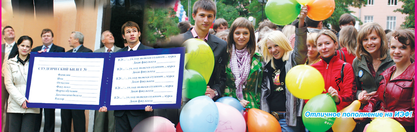
Отличное пополнение на ИЭФ!