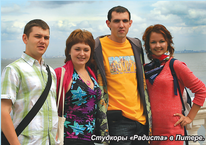
Студкоры «Радиста» в Питере.