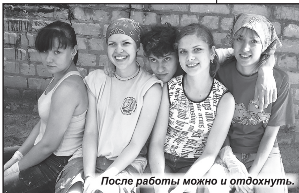
После работы можно и отдохнуть.