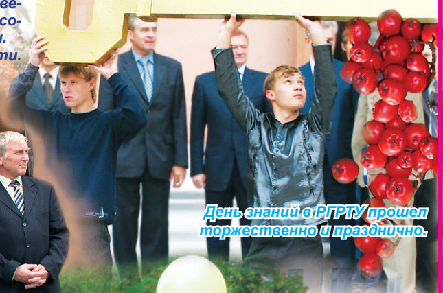
День знаний в РГРТУ прошел торжественно и празднично.