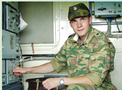
Обретаем навыки военные.