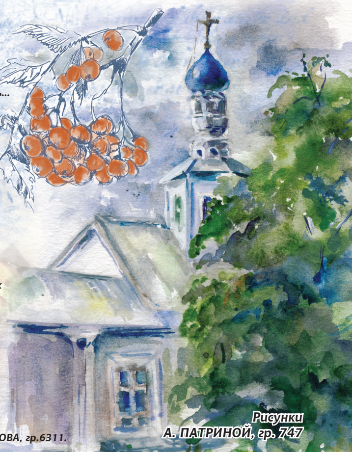
Рисунки А. ПАТРИНОЙ, гр. 747