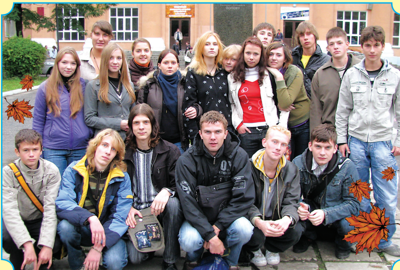
Первое сентября – снимок на память.

– Хочу в радиоуниверситете участвовать в художественной самодеятельности, люблю сочинять стихи. О поступлении в РГРТУ задумалась, еще учась в девятом классе. Посещая занятия Городской школы программистов, я познакомилась с преподавателями. Самое главное для меня – получить высшее образование, найти новых друзей и обязательно проявить себя в одном из видов самодеятельности.