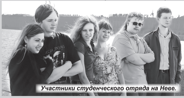
Участники студенческого отряда на Неве.