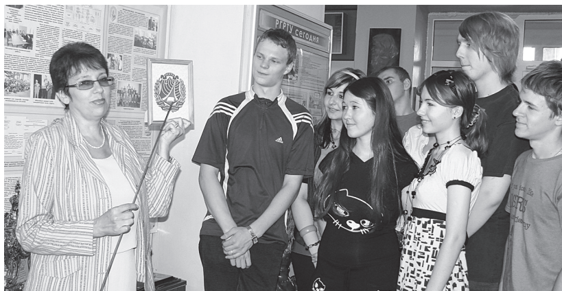
Первокурсники знакомятся с экспозицией музея.