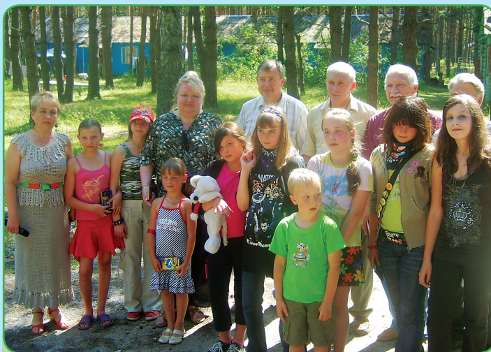
После награды победителей состязаний – снимок на память с руководством вуза.