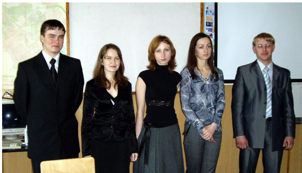
Первый выпуск магистров "Экономики" (2007 г.)

2007 год – выпуск первых бакалавров и магистров по направлению «Экономика»