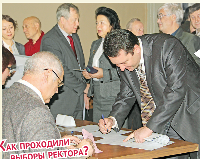
КАК ПРОХОДИЛИ ВЫБОРЫ РЕКТОРА?

П роводить выездной лагерь-семинар студенческого актива первого курса РГРТУ в разгаре осеннего семестра стало традицией. В этом году «Поколение» состоялось в десятый раз. Разработка социальных проектов, творческие вечера, тренинги и увлекательные лекции – благодаря всем этим мероприятиям первокурсники по-новому взглянули на увлекательную жизнь студенчества и попытались найти свое место в богатом мире возможностей, который открывает университет для молодежи. >>> Стр. 5.