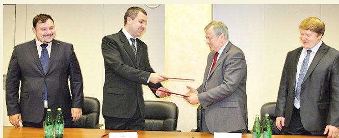
В разработке инновационной светотехнической продукции предприятие планирует задействовать наших выпускников.

курса по общим основам светотехники и LED (светодиодам). У студентов же появится возможность прохождения практики и последующего трудоустройства на предприятие. ■