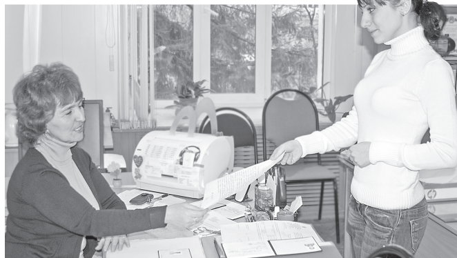
Матпомощь может начисляться один раз в семестр.

Сколько? Размер социальной стипендии не может быть меньше 150% от минимального размера академической стипендии. Социальная стипендия назначается в начале учебного года сроком на 1 год. Для того чтобы получить «социалку», нужно предоставить в деканат до установленной ранее даты (обычно до 1 октября текущего года) справку из органов соцзащиты по месту жительства, подтверждающую право на получение социальной стипендии. Эта мера введена для удобства работы стипендиальной комиссии, но по законодательству справку можно предоставить в любое время, и социальная стипендия все равно будет назначена.