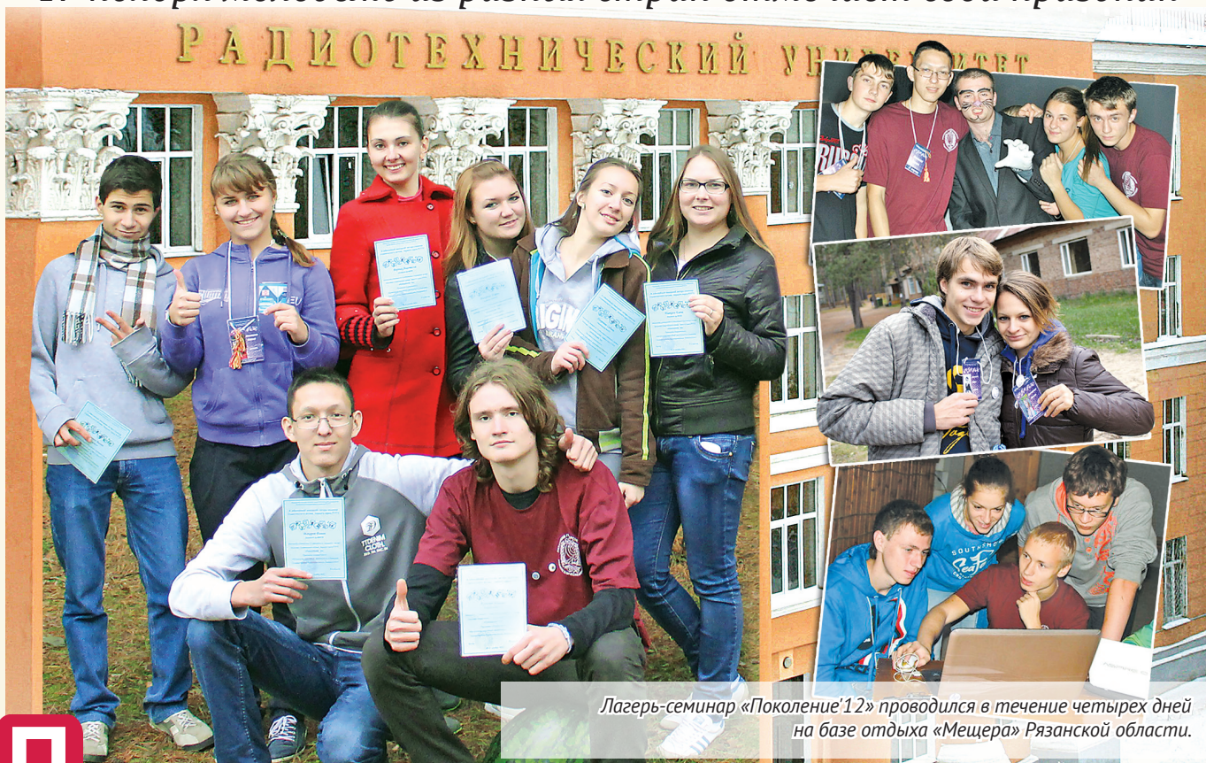
Лагерь-семинар «Поколение'12» проводился в течение четырех дней на базе отдыха «Мещера» Рязанской области.

17 ноября молодежь из разных стран отмечает свой праздник