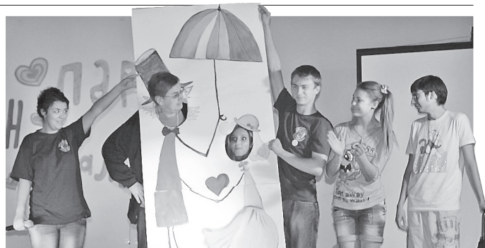
Первокурсники пожелали поехать на «Поколение» и в следующем году. Но уже в роли оргкомитета.

Что же касается X юбилейного лагеря-семинара студенческого актива, то он проходил на