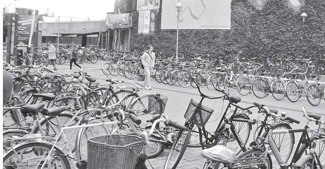
Площадка перед швецикам университетом Линчепинг. Никаких выхлопов и проблем с парковкой!

Немалое удивление у рязанцев вызвал и тот факт, что в Стокгольме практически все ездят на велосипедах, а рядом с университетом выделена огромная площадка для велопарковки.