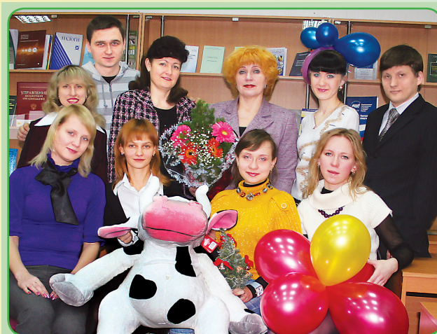
Преподаватели и студенты кафедры.