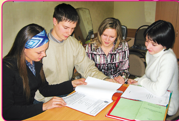
Сотрудники службы качества с экспертом ВНИИС.

У ниверситет вошел в список вузов-участников опытного применения документа «Методика оценки систем качества образовательных учреждений». С 6 по 8 ноября в РГРТУ проводилась экспертиза системы качества экспертами-аудиторами, которые отметили хороший потенциал и динамику