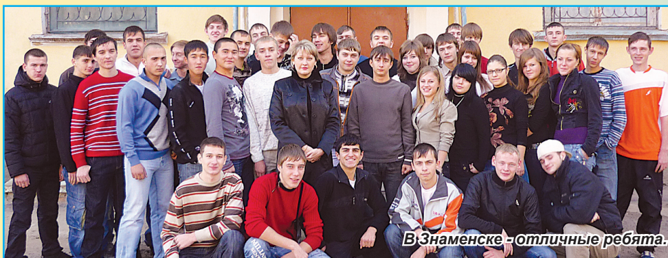
В Знаменске — отличные ребята.