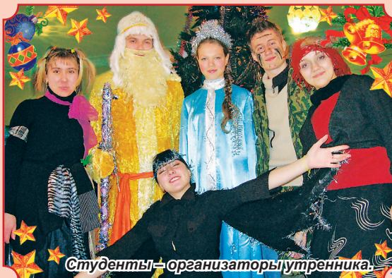
Студенты – организаторы утренника.