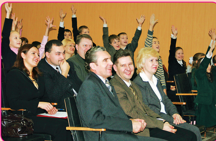
Школьный концерт всем пришелся по душе.