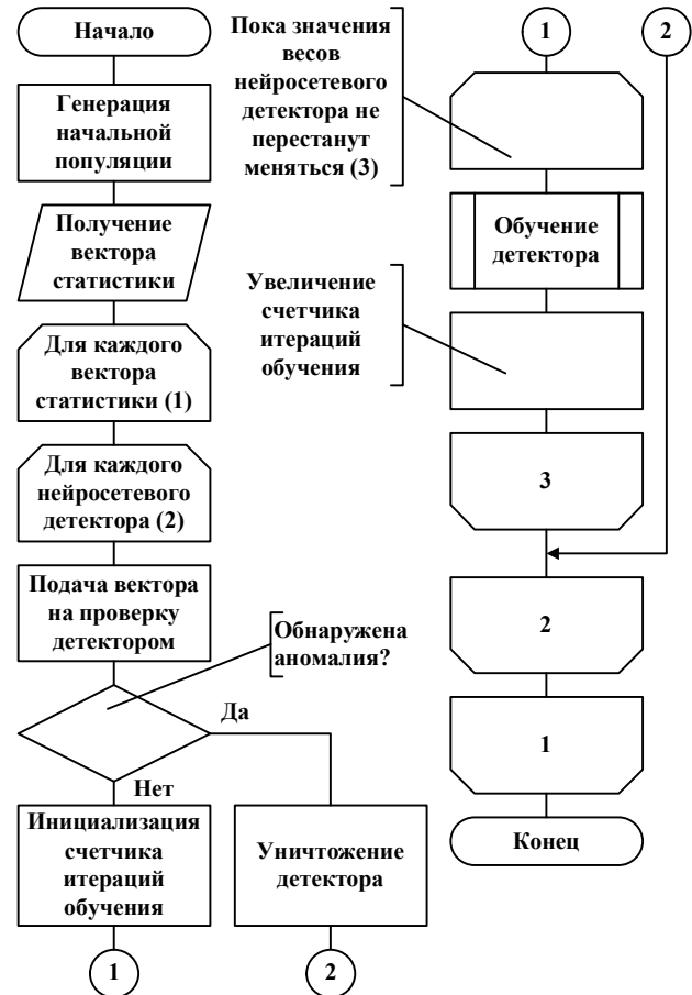
Рисунок 2 – Алгоритм работы системы в режиме обучения

торов. Те детекторы, которые обнаружили в данном векторе аномальную активность (а ее по определению быть не должно), удаляются из популяции. Данный алгоритм реализует механизм «отрицательного отбора» искусственной иммунной системы.